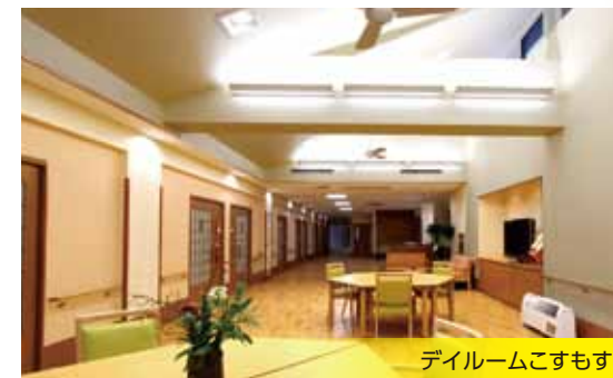
ダイルムこすもす

日々の団らんやレクリエーション、療法や教室など多種多様なスペースとして活用しています。