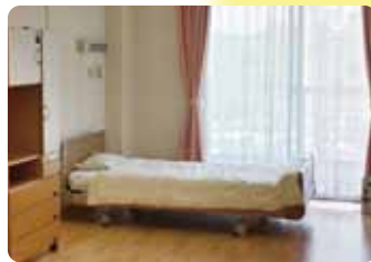
1人部屋 自分のペースで ゆったりとくつろぐ