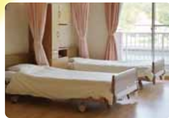
2人部屋 充実したスペースの 2人部屋