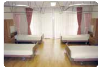
多床室 常に誰かいる安心。 楽しい団らん生活