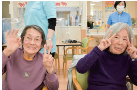
他のご利用者様との交流