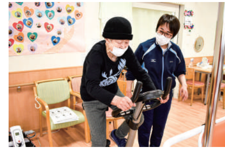
福祉用具等の利用や方法を工夫しての練習