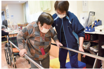
難しくなった運動そのものの練習