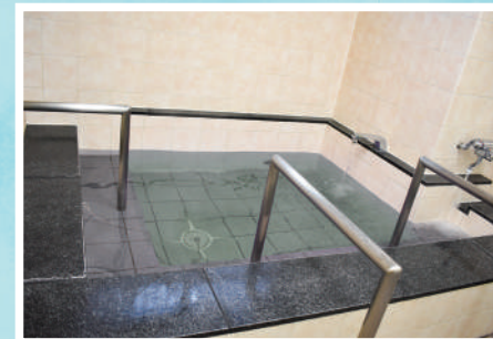
風呂場(特浴もあります)