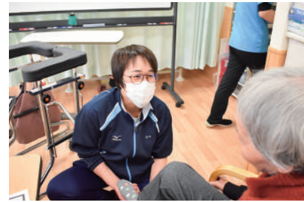
身体機能へのアプローチ(筋力・可動域等)