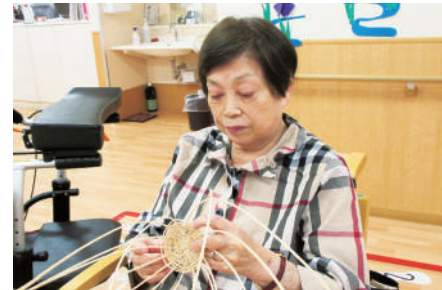
作品づくり(工作・手芸等)