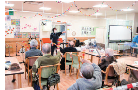
コグニサイズ(認知症予防運動)

生活に必要な機能を維持・改善し「その人らしい」生活の維持及び質の向上を目指します。